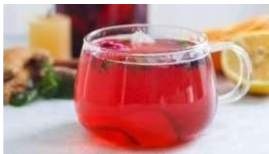
Gambar 2.3.9 Menu Minuman Hibiscus Lemon Ginger Tea

Hibiscus Lemon Ginger Tea merupakan minuman yang memukau dengan kombinasi bahan-bahan berkualitas tinggi. Teh ini diinfus dengan kelopak bunga rosella yang memberikan warna merah cerah dan cita rasa yang segar. Tambahan perasan lemon menambahkan sentuhan kesegaran dan keasaman yang lembut, sementara jahe memberikan sentuhan hangat dan sedikit kepedasan yang menyenangkan. Gabungan ketiga bahan ini menciptakan harmoni unik yang memanjakan lidah