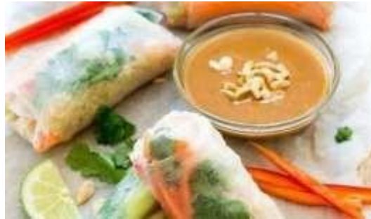
Gambar 2.3.4 Menu Makanan Veggie Roll

Untuk menu yang keempat adalah veggie roll menu ini merupakan menu yang penulis ciptakan bagi orang-orang yang menginginkan sensasi memakan salad roll yang berbeda. Dengan menggunakan bahan sayuran yang segar. Salad ini juga menggunakan rice paper sebagai bungkusannya yang menjadikan salad ini terlihat isian salad yang indah. Menu ini sendiri sangat bagus untuk orang yang ingin diet, terutama orang yang terkena penyakit fatty liver .