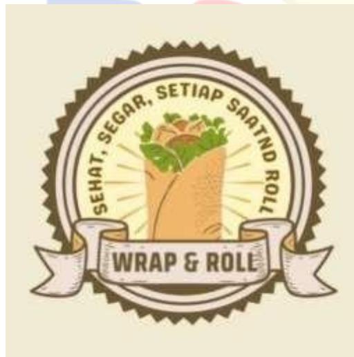
Gambar 2.7.2.1 Logo Wrap N Roll

Logo Wrap N Roll didesain dengan cermat untuk mencerminkan nilai-nilai merek Wrap N Roll: