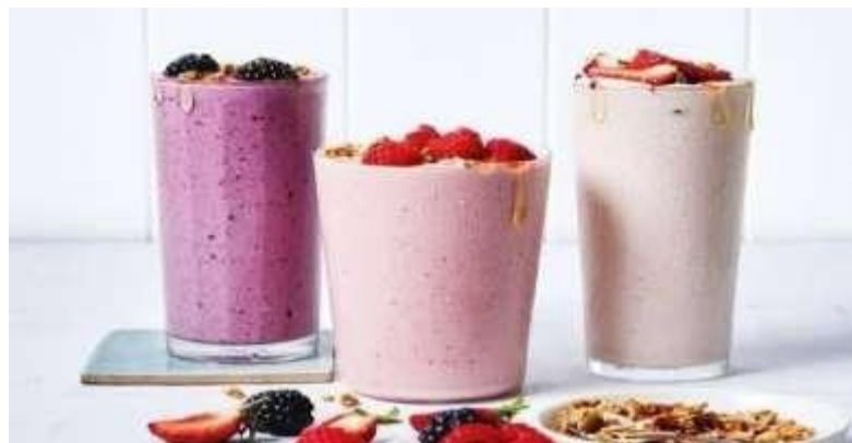
Gambar 2.3.7 Menu Minuman Berry Smoothies

Berry Smoothies adalah minuman segar yang terbuat dari campuran berbagai jenis buah beri, seperti stroberi, blueberry, dan raspberry, yang di-blend bersama yogurt atau susu. Rasa lezat dan manis alami buah-buahan tersebut memberikan sentuhan segar dan nikmat pada setiap tegukan. Smoothies ini tidak hanya menyajikan kenikmatan rasa, tetapi juga kaya akan nutrisi dan antioksidan dari beri-berian yang digunakan