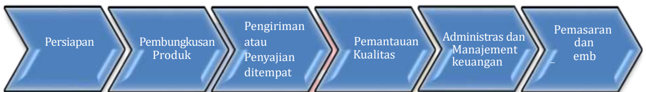
Gambar 2.5.1 Tahap Pesanan dan Pemesanan

Proses dimulai ketika pelanggan pertama kali berinteraksi dengan Wrap N Roll, baik melalui toko fisik, aplikasi ponsel, atau situs web. Pelanggan memilih jenis salad yang Konsumen inginkan, termasuk Wrap Salad atau Kerucut Salad, serta pilihan bahan tambahan dan saus. Setelah pesanan diterima, tim koki dan staf dapur mulai mempersiapkan makanan. Mulai Wrap N Roll dibungkus dengan cermat menggunakan tortilla (untuk Wrap Salad) atau disusun dengan rapi dalam bentuk kerucut (untuk Kerucut Salad). Ini dilakukan untuk mempertahankan kualitas dan presentasi makanan. Setelah pesanan diterima, tim koki dan staf dapur mulai mempersiapkan makanan. Mulai dari memotong dan mempersiapkan sayuran segar, memasak protein (jika ada), dan menyiapkan saus sesuai pesanan. Ada dua opsi pengiriman produk: