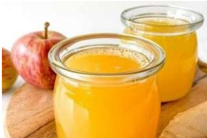
Gambar 2.3.12 Menu Minuman Apple Ginger Shot

Apple Ginger Wellness Shot adalah minuman yang terbuat dari kombinasi segar apel dan jahe yang memberikan pengalaman rasa unik dan menyegarkan. Dengan paduan manis alami apel dan kehangatan jahe, minuman ini tidak hanya menyajikan cita rasa yang lezat tetapi juga memberikan sensasi pemanasan yang menyegarkan di tenggorokan