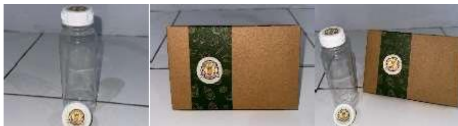
(Gambar 2.7.5.1 Packaging untuk Wrap N Roll)

Untuk packaging sendiri Wrap n Roll menggunakan kotak yang berwarna coklat muda dan ditutup kotak tersebut ada desain garis yang gelap dengan gambar berbagai macam makanan dan di tengah garis gelap tersebut ada gambar stiker logo dari Wrap N Roll. Untuk minuman dari Wrap n Roll menggunakan botol plastik dan di tutup botol tersebut terdapat stiker logo Wrap N Roll.