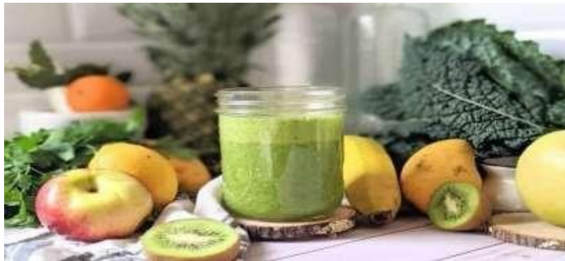
Gambar 2.3.8 Menu Minuman Green Goddess Smoothies

Green Goddess Smoothies adalah minuman segar yang terdiri dari campuran bahan-bahan berkualitas tinggi untuk menciptakan pengalaman nikmat yang menyehatkan. Dengan kombinasi sayuran hijau seperti bayam dan kale, buah-buahan segar seperti pisang dan kiwi, serta tambahan bahan bermanfaat seperti chia seeds dan yogurt, smoothie ini tidak hanya memberikan rasa yang menyegarkan, tetapi juga menyajikan khasiat kesehatan yang luar biasa.