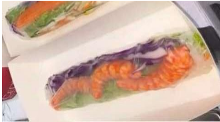
Gambar 2.3.6 Menu Makanan Shrimp Roll

Menu keenam Wrap N Roll ada shrimp roll, shrimp roll ini adalah salad roll yang menggunakan shrimp tail dan rice paper sebagai daya tarik utamanya, selain dapat memamerkan bentuk ekor udangnya yang besar dan menggoda, Konsumen juga dapat melihat dalaman sayuran yang sangat segar.