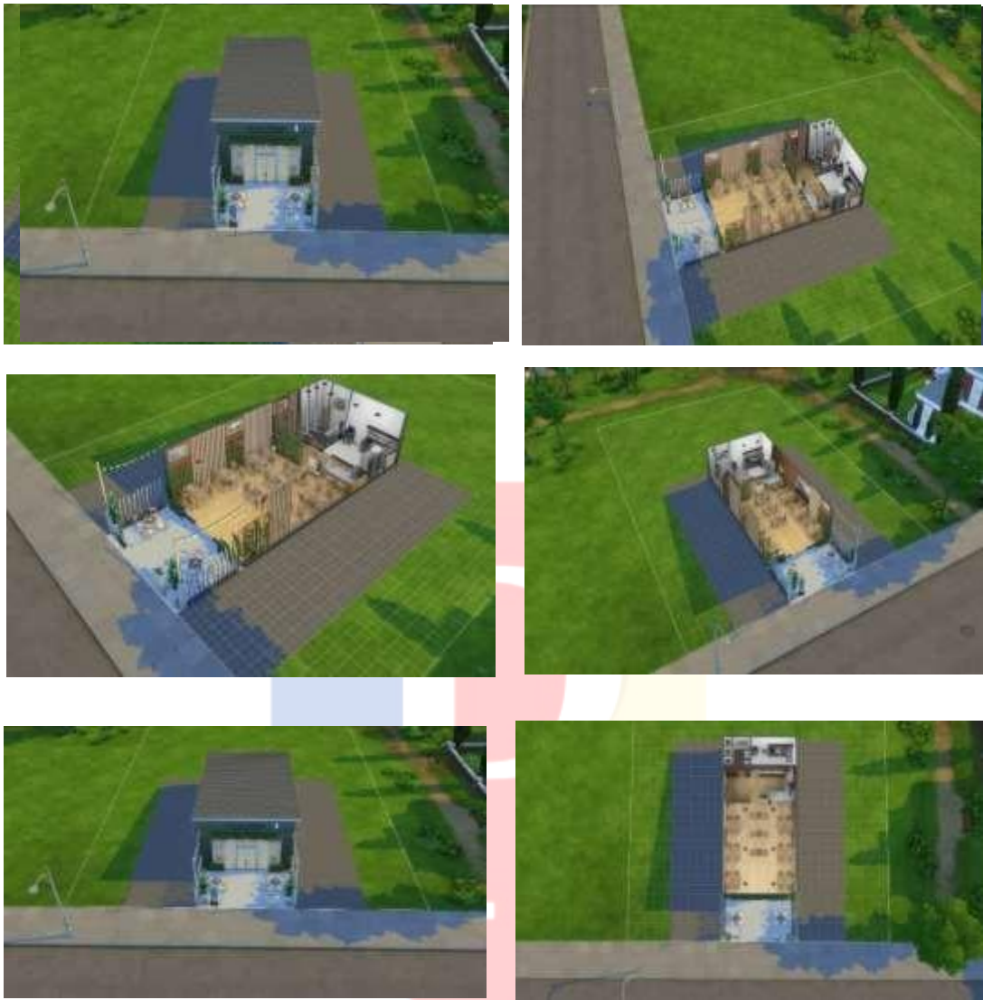
Gambar 2.3.2.1 Layout Wrap N Roll

Berdasarkan dari gambar di atas, maka dapat dijelaskan bahwa restoran direncanakan memiliki total luas 40m 2 dengan bentuk ruangan memanjang. Terdapat 2 meja kotak di area outdoor yang masing-masing berkapasitas 4 orang, 3 meja kotak di area indoor yang masing-masing berkapasitas 2 orang, dan 6 meja panjang di area indoor dengan kapasitas 4 orang per meja. Sehingga total daya tampung adalah 38 orang. Semua meja dilengkapi dengan menu holder dan pot kecil berisi tanaman succulent sebagai sentuhan dekorasi alami. Pencahayaan berasal dari lampu gantung dan jendela kaca, ventilasi didukung AC split. Fasilitas penunjang terdiri dari 3 bilik toilet dan 2 wastafel untuk mencuci tangan, dipisahkan dari area makan menggunakan partisi. Dekorasi didominasi ornamen tanaman