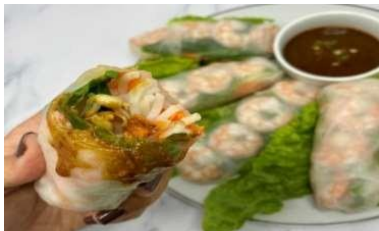
Gambar 2.3.5 Menu Makanan Crabyo Roll

Untuk menu yang kelima Wrap N Roll ada crabyo roll. Crabyo roll ini sendiri diciptakan sebagai alternatif orang-orang yang ingin menikmati salad seafood tanpa khawatir terkenanya alergi-alergi makanan tertentu, seperti alergi udang dan cumi. Untuk bungkusannya sendiri Wrap N Roll memilih rice paper sebagai luaran roll agar daya tarik dari makanan ini (sayuran dandaging) terlihat jelas, yang dapat membuat menu ini sangat menarik.