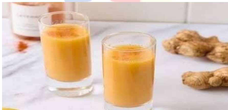
Gambar 2.3.11 Menu Minuman Citrus Cayenne Wellness Shot

Cayenne Wellness Shot adalah minuman berenergi yang segar dan menyegarkan yang menggabungkan cita rasa jeruk yang citarasa dengan sentuhan pedas dari cabai cayenne. Terbuat dari bahan- bahan alami seperti jeruk segar, jahe, madu, dan cabai cayenne, minuman ini tidak hanya memberikan kenikmatan rasa yang unik, tetapi juga membawa manfaat kesehatan.