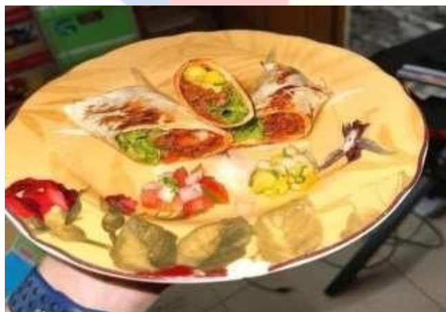
Gambar 2.3.1 Menu Makanan Salad Wrap N Roll

Dalam penyajiannya Wrap N Roll juga menawarkan beberapa macam pilihan saus sebagai pelengkap. Seperti lemon butter sauce, honey drizzled, dan juga chilli sauce. Selain itu penulis juga menawarkan 2 pelengkap yang ditonjolkan seperti tomat salsa dan nanas salsa, yang berisikan bawang bombai, daun ketumbar, honey dressing dll, yang penulis buat homemade dengan resep spesial yang diturunkan dari resep hotel ternama.