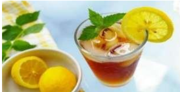
Gambar 2.3.10 Menu Minuman Citrus Mint Ice Tea

Minuman Citrus Mint Ice Tea merupakan sebuah minuman menyegarkan yang dihasilkan dari campuran teh, potongan buah citrus (seperti jeruk, lemon, atau lime), dan daun mint segar. Rasanya unik dan seimbang antara keasaman dari buah citrus yang memberikan sentuhan segar dan aroma harum mint yang menenangkan. Kombinasi yang menyegarkan ini memberikan pengalaman minum yang menyenangkan, terutama ketika disajikan dalam bentuk es.