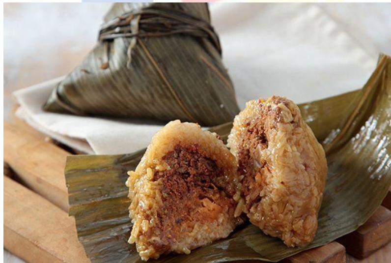
Gambar 2.1.1.3 Kuliner Bacang beras