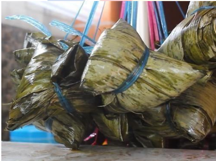
Gambar 2.1.1.1 Kumpulan Bacang Ketan dan Beras