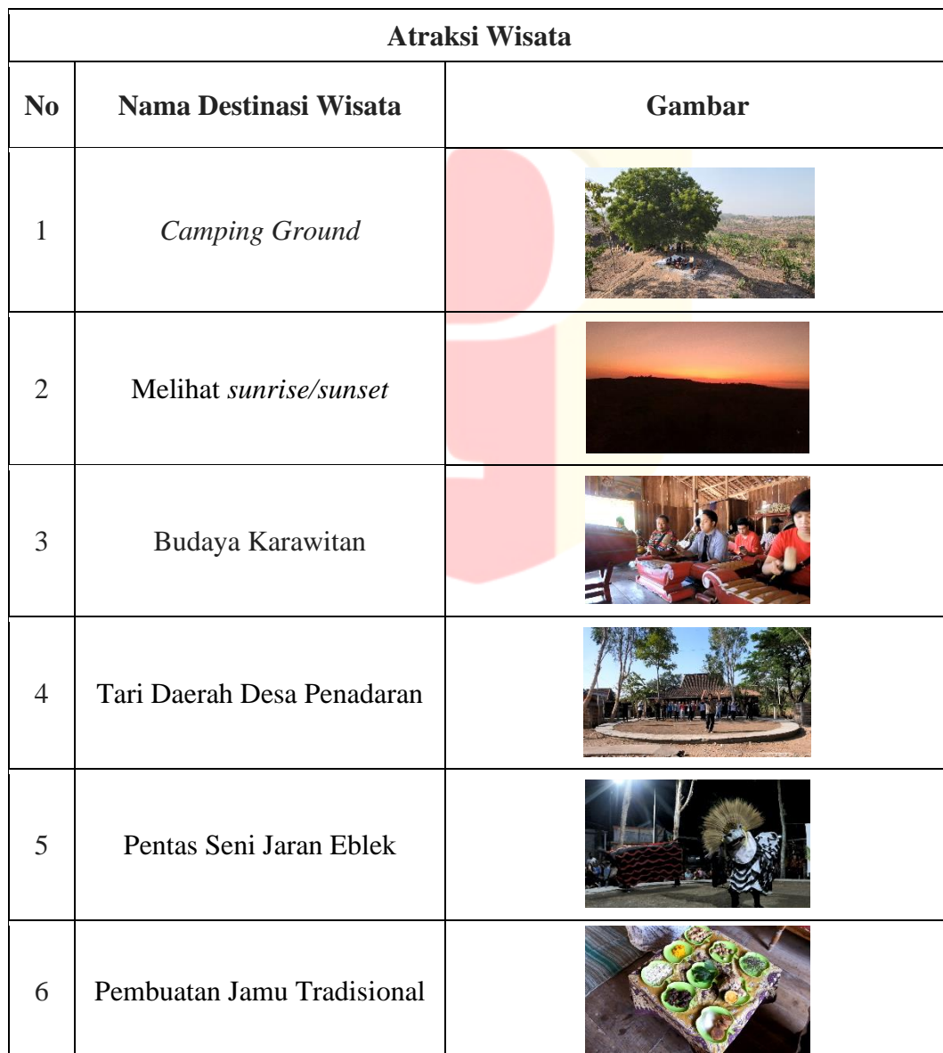
Tabel 4.2.2 Atraksi Wisata Unggulan yang ada di Desa Wisata Penadaran