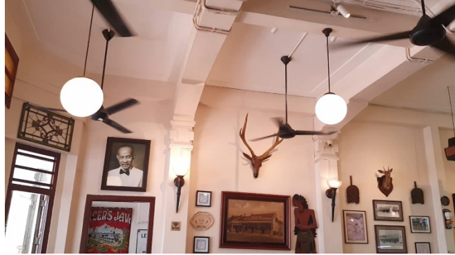
Gambar 4. 2. 6 Kipas Angin, Lampu Gantung, dan Bingkai Foto

menggambarkan suasana tempo dulu. Di area belakang dekat area dapur terdapat flowing water , tangga menuju lantai dua, dan juga beberapa tempat duduk yang menggunakan kursi dan sofa.