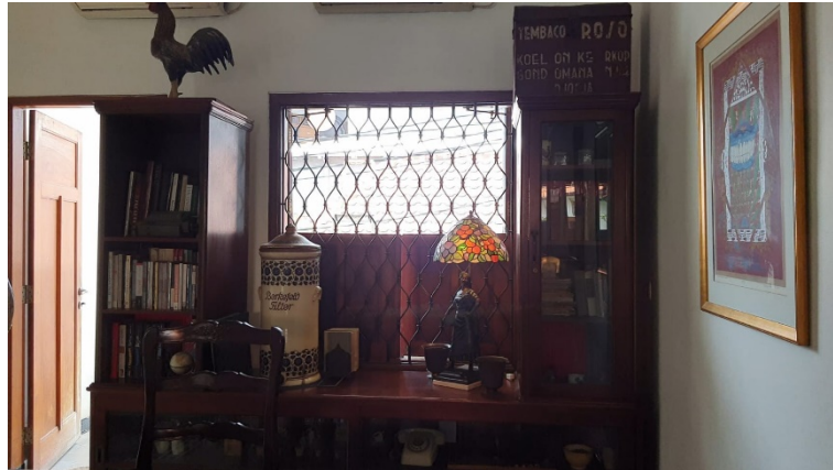
Gambar 4. 2. 2 Perabotan Asli Tempo Dulu