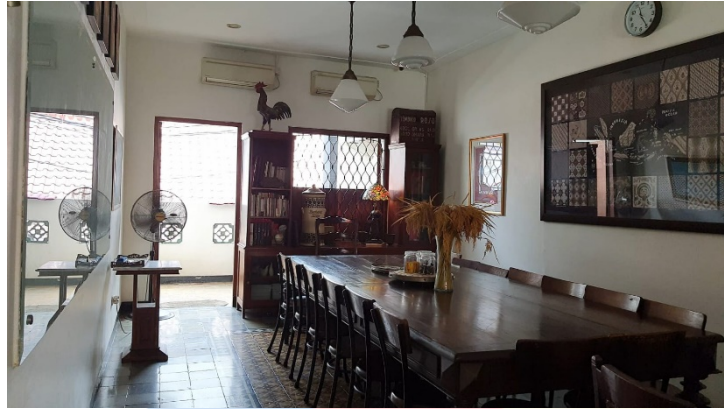
Gambar 4. 2. 9 Ruang Meeting

yang luas untuk para pengunjung yang datang dengan banyak orang. Sama seperti lantai satu, di lantai dua juga ada beberapa bingkai foto yang terpajang di dinding, gambaran peta perjalanan Bakoel Koffie, barang-barang antik, lampu gantung, air conditioner , perabotan asli dari zaman dulu, dan lainnya.