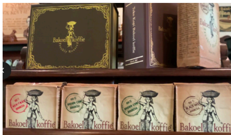
Gambar 4. 1. 2 House Blend

Bakoel Koffie memiliki racikan sendiri ( house blend ) yang tidak dapat ditemukan di kedai kopi lain. Bakoel Koffie menggunakan biji kopi pilihan yang diambil dari berbagai daerah di Indonesia yaitu Pulau Sulawesi, Pulau Jawa, Sumatera Utara, dan Sumatera Selatan. Untuk house blend heritage yang pencampuran biji kopinya berasal dari dataran tinggi Sumatera Utara dan Selatan, memiliki aroma coklat yang padat dan cocok diminum untuk keadaan panas seperti kopi tubruk, black , americano , dan espresso . Lalu, untuk house blend black mist yang pencampuran biji kopinya berasal dari Pulau Sulawesi dan Jawa, memiliki aroma butter caramel dan cocok diminum dalam keadaan dingin seperti es kopi dan cold brew . Selanjutnya untuk house blend brown cow yang pencampuran biji kopinya berasal dari Sumatera Utara, Sulawesi dan Jawa, memiliki aroma kacang-kacangan dan cocok dipadukan dengan susu seperti ice latte , cappucino , dan kopi kampoeng.