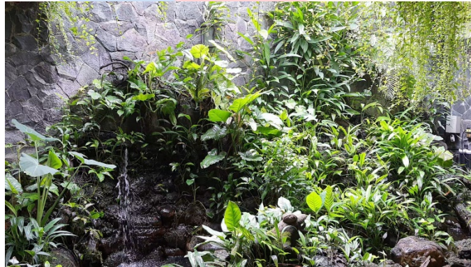
Gambar 4. 2. 7 Flowing Water