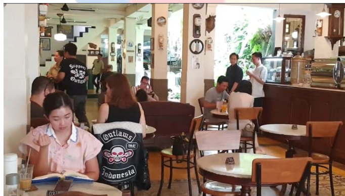
Gambar 4. 2. 8 Suasana Bakoel Koffie, Cikini

Pada lantai dua Bakoel Koffie, suasana yang dirasakan sama dengan suasana yang ada di lantai satu. Di lantai dua adalah area non-smoking dan tersedia ruangan yang terdiri dari ruang meeting , ruang VIP, office , toilet, dan beberapa meja