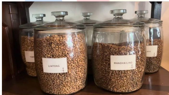
Gambar 4. 2. 5 Single Origin

Pada lantai satu Bakoel Koffie adalah area smoking , suasana yang diberikan saat pengunjung memasuki Bakoel Koffie adalah suasana vintage seperti datang ke rumah kakek dan nenek. Di dekat area pintu masuk terdapat area bar, kasir, tangga menuju lantai dua, beberapa tempat duduk yang menggunakan kursi dan sofa, kipas angin, lampu gantung, serta beberapa bingkai foto yang