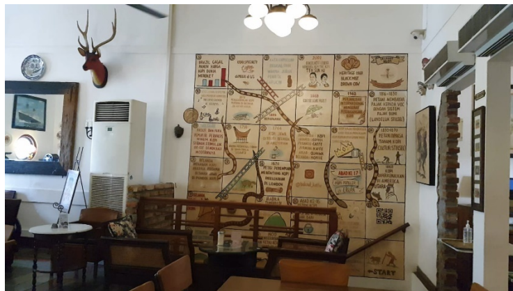
Gambar 4. 2. 3 Gambar Peta Perjalanan Bakoel Koffie