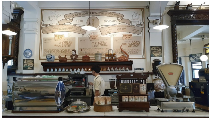
Gambar 4. 2. 4 Bar

Area bar ditempatkan di dekat pintu masuk, sehingga saat memasuki Bakoel Koffie langsung tercium aroma kopi. Selain itu, peralatan bar-nya masih menggunakan beberapa alat yang digunakan pada zaman dahulu. Di samping area bar terdapat pajangan berupa house blend dan berbagai macam single origin yang berasal dari beberapa daerah di Indonesia seperti Kopi Luwak dari Jawa dan Sumatera, Kopi Jawa dari Jawa, Kopi Gayo dari Sumatera, Kopi Toraja dari Sulawesi, Kopi Lintong dari Sumatera Utara, Kopi Kintamani dari Bali, Kopi Mandheiling dari Samosir, dan Kopi Bajawa dari Flores.