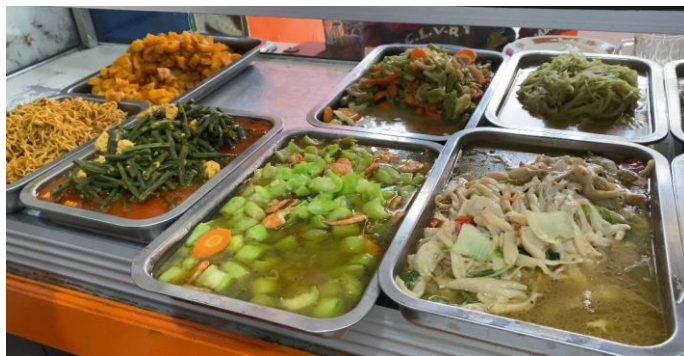
Gambar 2. 3 Hidangan di Warteg Kharisma Bahari

Warteg Kharisma Bahari mendapatkan apresiasi oleh Kementerian Koordinator Bidang Perekonomian pada acara KUR award kategori provinsi pada tahun 2022 di Jakarta. Apresiasi ini didapatkan karena warteg Kharisma Bahari mencapai pendapatan hingga 1 miliar. Warteg Kharisma Bahari juga mendapatkan penghargaan sebagai salah satu merek terbaik pilihan pelanggan dalam digital media.