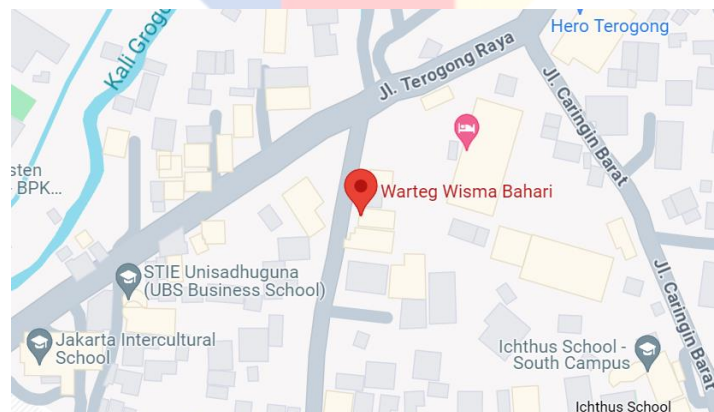
Gambar 2. 2 Google Maps Lokasi Warung Tegal Kharisma Bahari

Warung Tegal Kharisma Bahari sendiri terlihat begitu sederhana, dari tempat makan yang tergolong murah, dan juga harga makanan yang cukup terjangkau. Salah satu Warung Tegal Kharisma Bahari yang kita ingin meninjau lebih dalam yang terletak di 3, Jl. Batong Raya No.2a, RT.3/RW.6, Cilandak Barat, Cilandak, Kota Jakarta Selatan, Jakarta 12430.