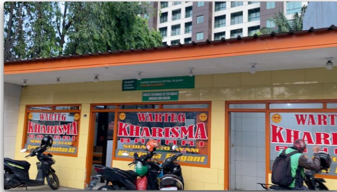
Gambar 2. 1 Warung Tegal Kharisma Bahari