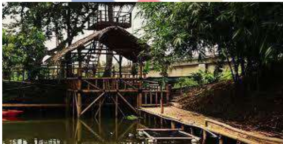
Gambar 2.1.1.2 Rumah Makan Saung Cisadane

Menurut Putra, T. R (2013) dalam jurnal pembangunan wilayah dan kota, daya tarik wisata budaya dalam sebuah desa wisata merupakan perpaduan dari kegiatan sosial dan budaya masyarakatnya, dimana hal semacam ini tergambar dalam kehidupan masyarakat, serta aktivitas masyarakat. Atraksi wisata budaya Kampung Ekowisata Keranggan adalah kerajinan tangan dan kuliner. Kerajinan tangan yang terbuat dari koran bekas, bungkus plastik dan tali kur. Budaya yang terdapat di Kampung Ekowisata Keranggan adalah sunda terlihat dari adanya rumah makan khas Sunda yaitu Rumah Makan Saung Cisadane yang menyajikan makanan tradisional khas sunda seperti ikan pecak dan ikan cere. Selain itu,