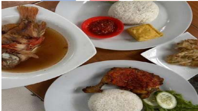
Gambar 2.1.1.4 Ikan Pecak dan Ayam Penyet Cabe Rumah Makan Saung Cisadane