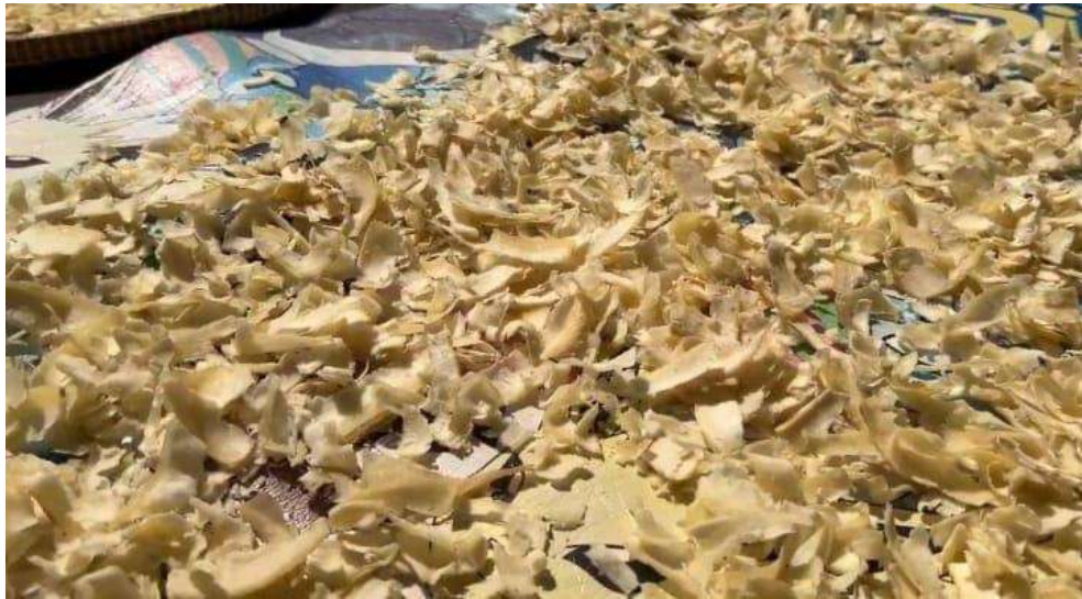
Gambar 2.1.1.3 Keripik Kerecek

terdapat UMKM Rumah Industri yang menghasilkan aneka keripik dan kacang sangrai sebagai pusat oleh - oleh khas keranggan.