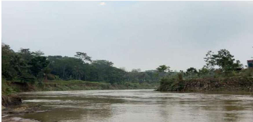
Gambar 2.1.1.1 Sungai Cisadane