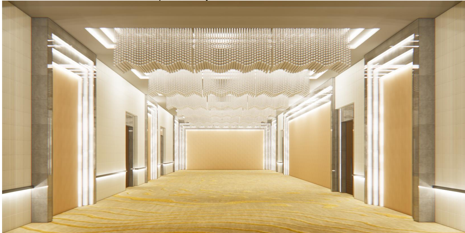
Lampiran 17 Proyeksi Dekorasi Venue Ballroom