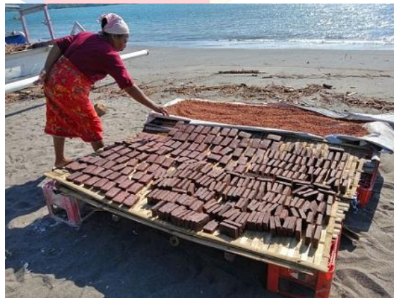
Gambar 1.2 Perajin terasi tradisional Cirebon

Pesisir Cirebon juga memiliki sejarah terkait penghasil terasi. Kondisi pesisir dengan kekayaan alam yang melimpah tersebut memudahkan untuk mendapatkan bahan baku dari pembuatan terasi, yaitu rebon. Nama Cirebon sendiri diambil dari bahasa Sunda, yaitu “cai” yang berarti air dan “rebon” yang berarti udang. Cai-rebon merupakan air dari sisa pembuatan terasi yaitu petis yang digunakan untuk memasak. Hal tersebut membuat Cirebon dikenal sebagai “Kota Udang” dan profesi tersebut menjadi salah satu komoditas unggulan di daerah Cirebon (Herwantono & Nugraha, 2021).