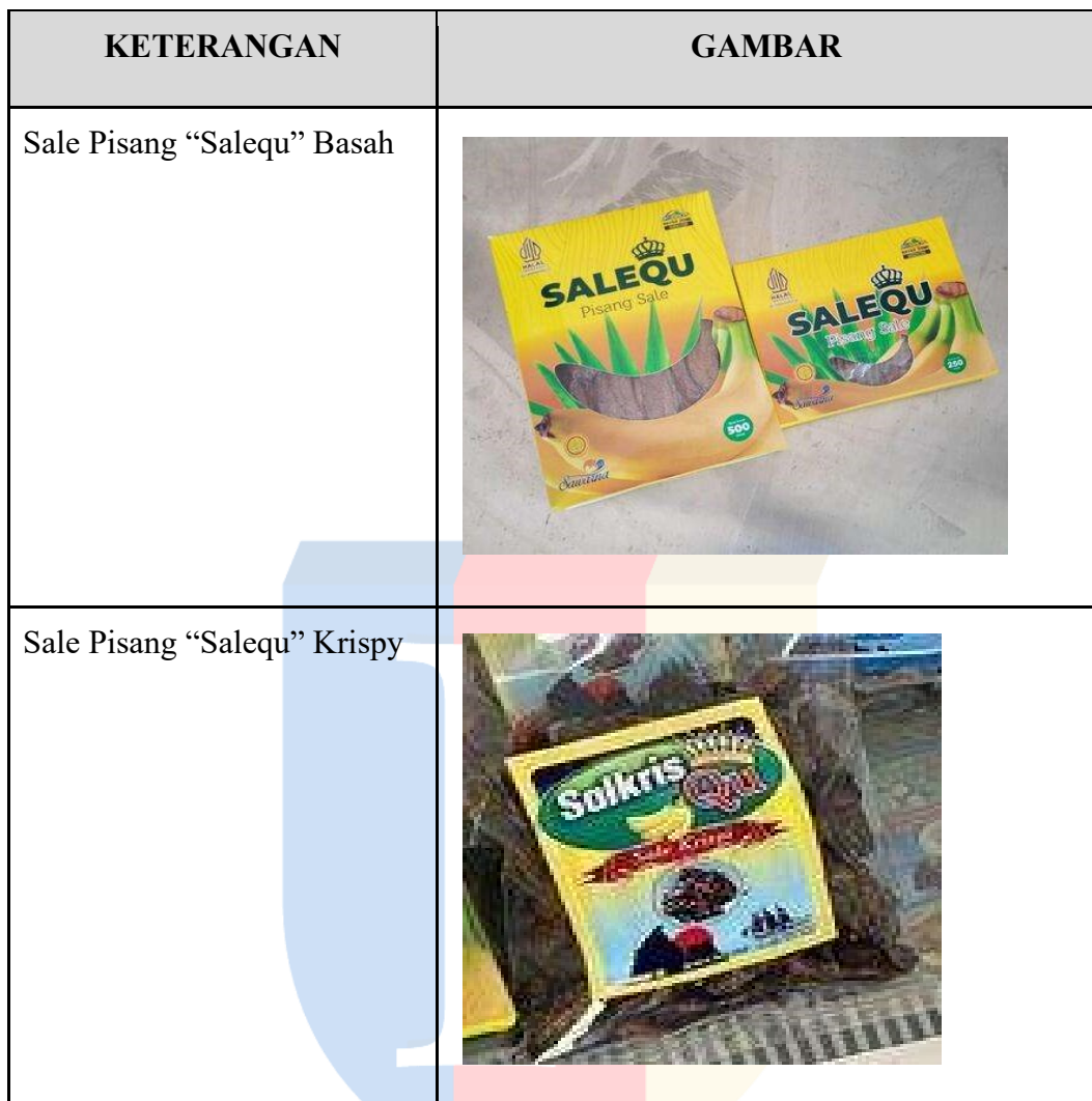
Table 2. 1 Gambar Produk Sale Pisang “Salequ”