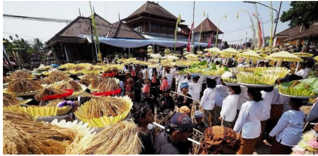
Gambar 2. 1. 1 Upacara Seren Taun