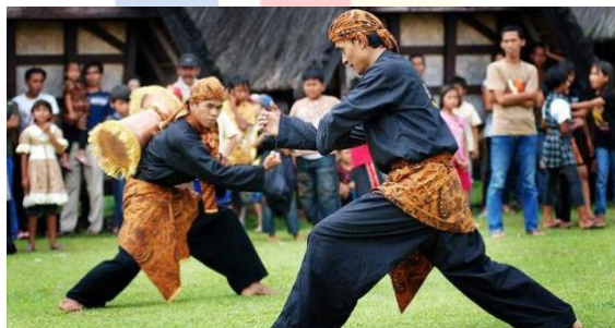
Gambar 2. 1. 2 Parebut Seeng