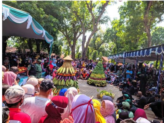
Gambar 2. 1. 3 Upacara Sedekah Bumi