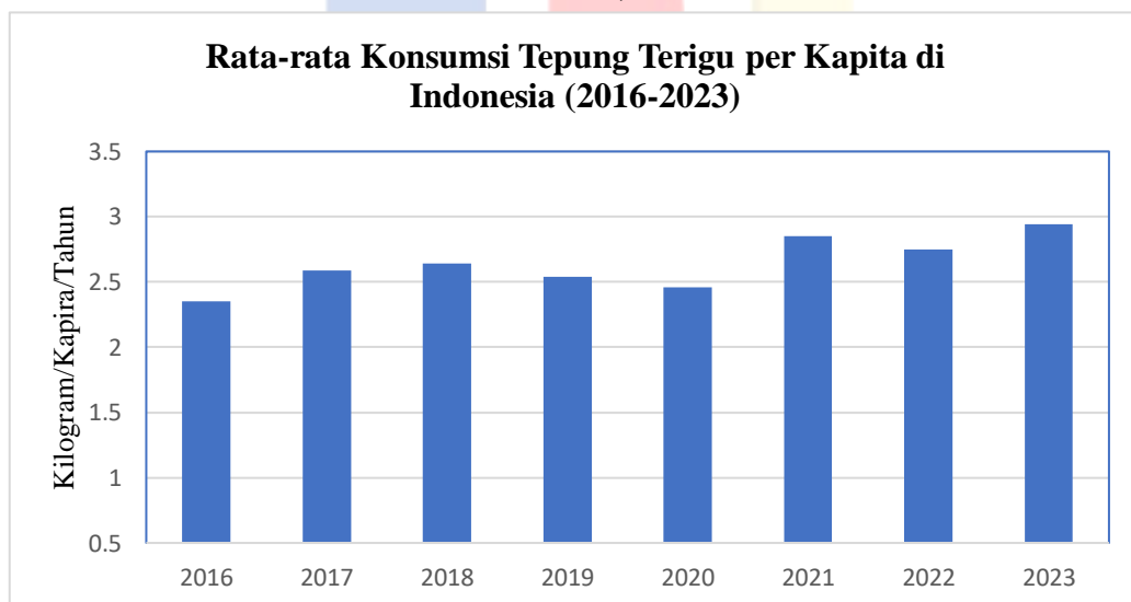
Grafik 1. 1 Rata-rata Konsumsi Tepung Terigu per Kapita di Indonesia (2016 - 2023)

Sumber : laporan Statistik Konsumsi Pangan dari Kementerian Pertanian (2016-2023)