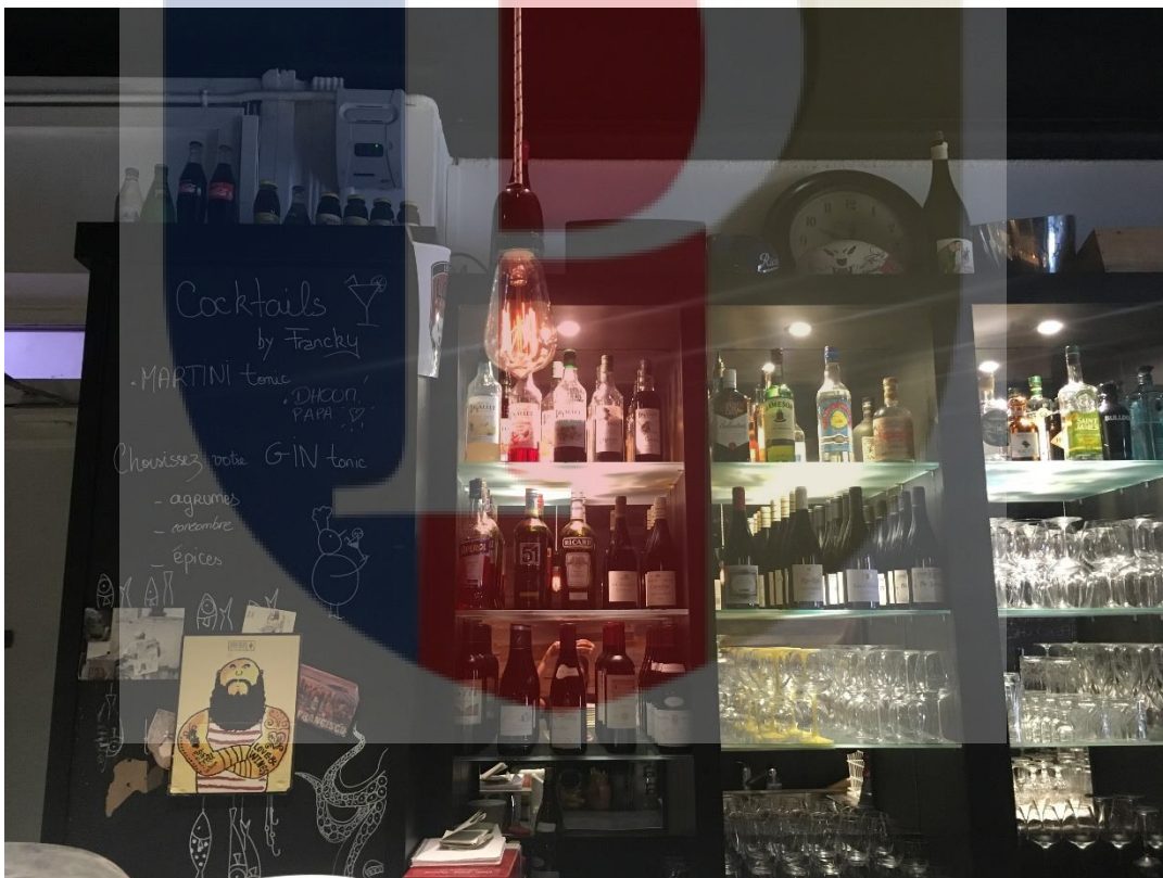
Bar Le Bistrot Du Potager#2