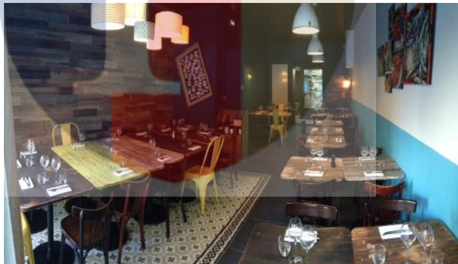
Ruang Kedua Le Bistrot Du Potager#2