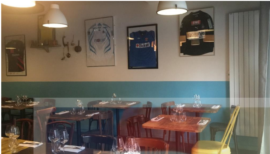
Ruang Kedua Le Bistrot Du Potager#2