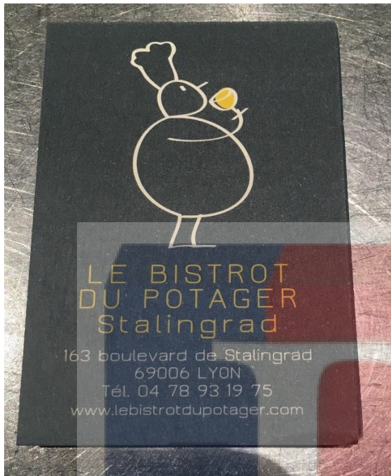
Kartu Bisnis Le Bistrot Du Potager#2