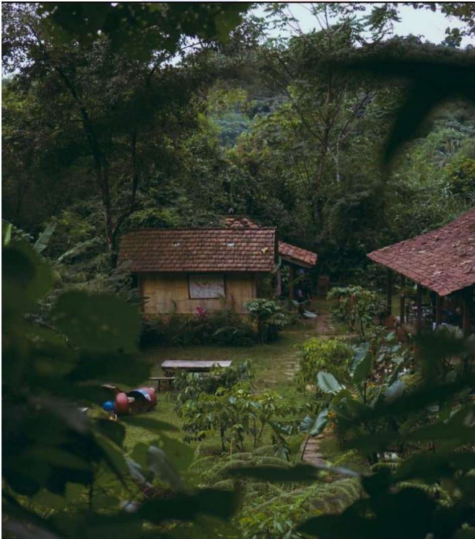
Lampiran 4. Penampakan Rumah Kopi Ranin.