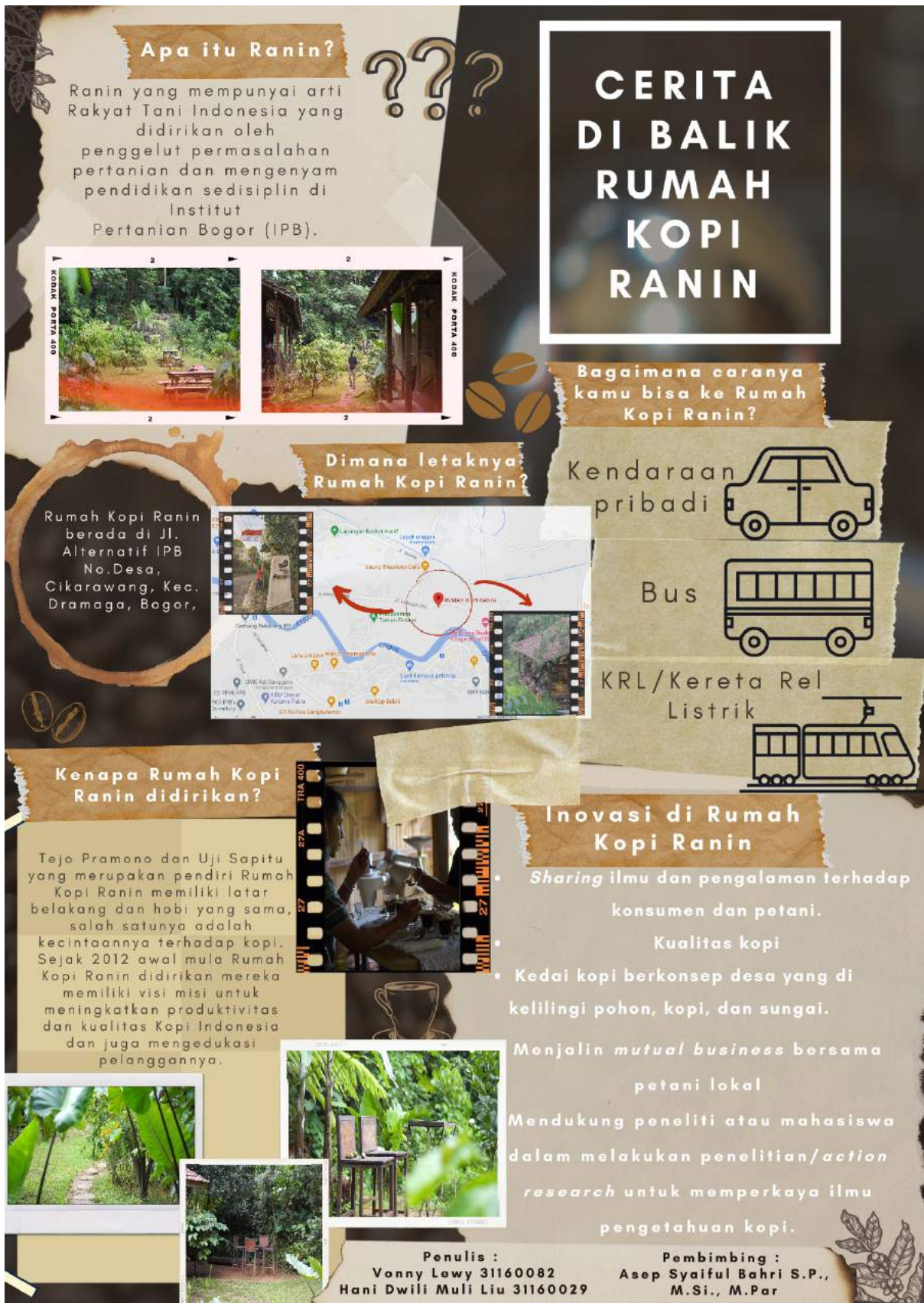
Lampiran 2. Poster Ilmiah Storytelling .