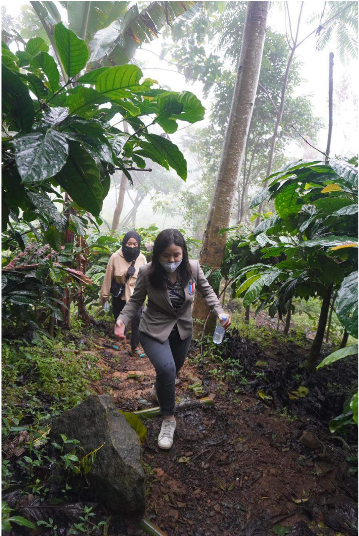
Lampiran 7. Perjalanan menuju kebun kopi Cibulao.