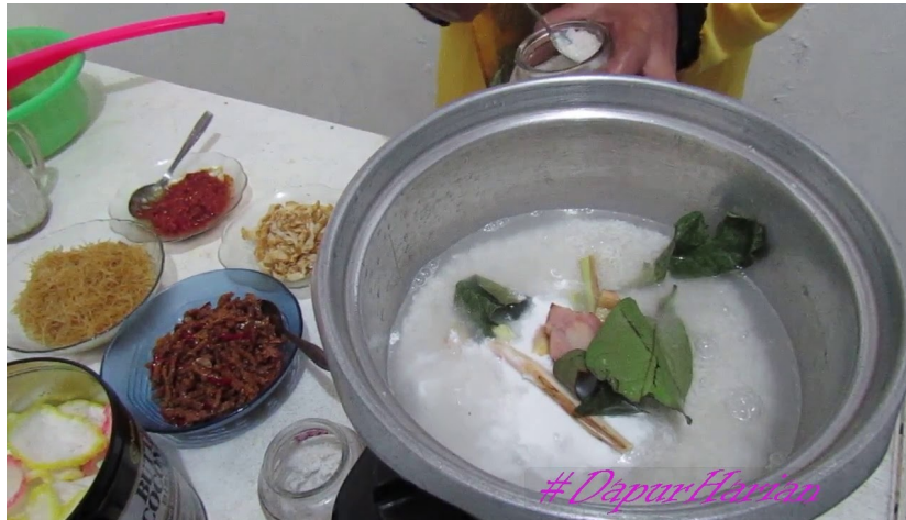
Gambar 3.1.8 Cara Membuat Nasi Uduk (Dapur Harian, 2017)