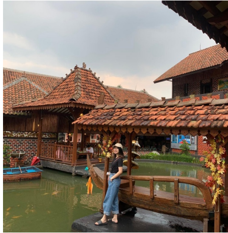
Gambar 3.1.4 Wisata di Kota Sukabumi Kampoeng Ikan