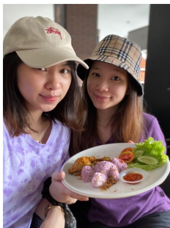
Gambar 3.1.10 Menyicipi nasi uduk ungu.