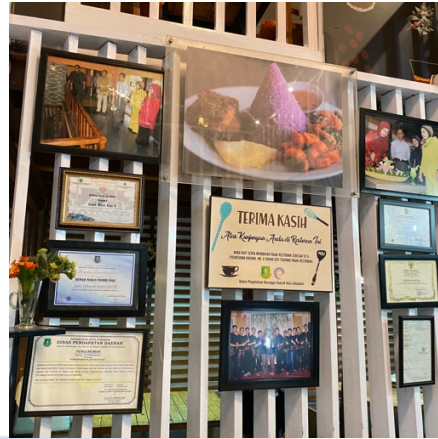
Gambar 3.1.6 Restoran Mamih Ungu