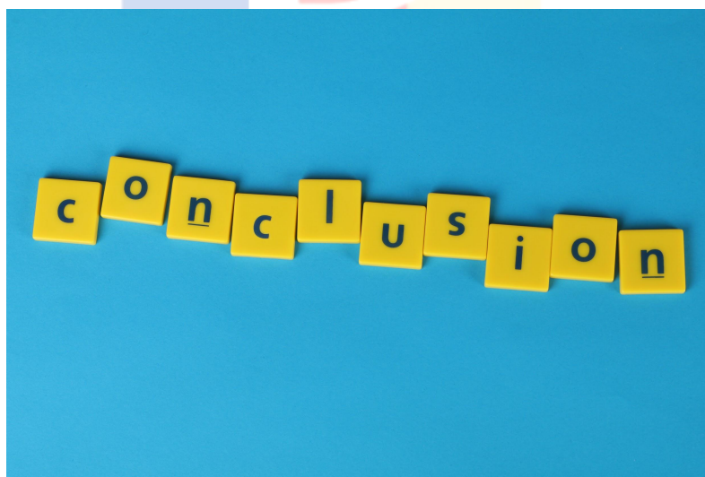
Gambar 3.1.11 Conclusion (google, 2017)