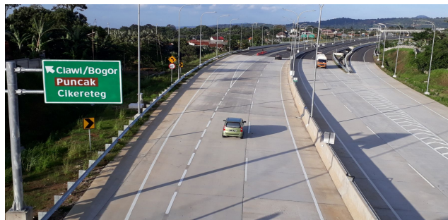
Gambar 3.1.2 Tol Bocimi (Media Indonesia, 2020)