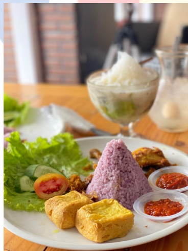
Gambar 3.1.5 Nasi Uduk Ungu