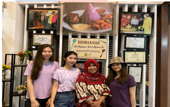
Gambar 3.1.1 Trio Diva