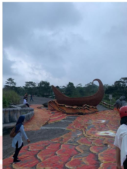
Lampiran 11 Wisata Gunung Merapi