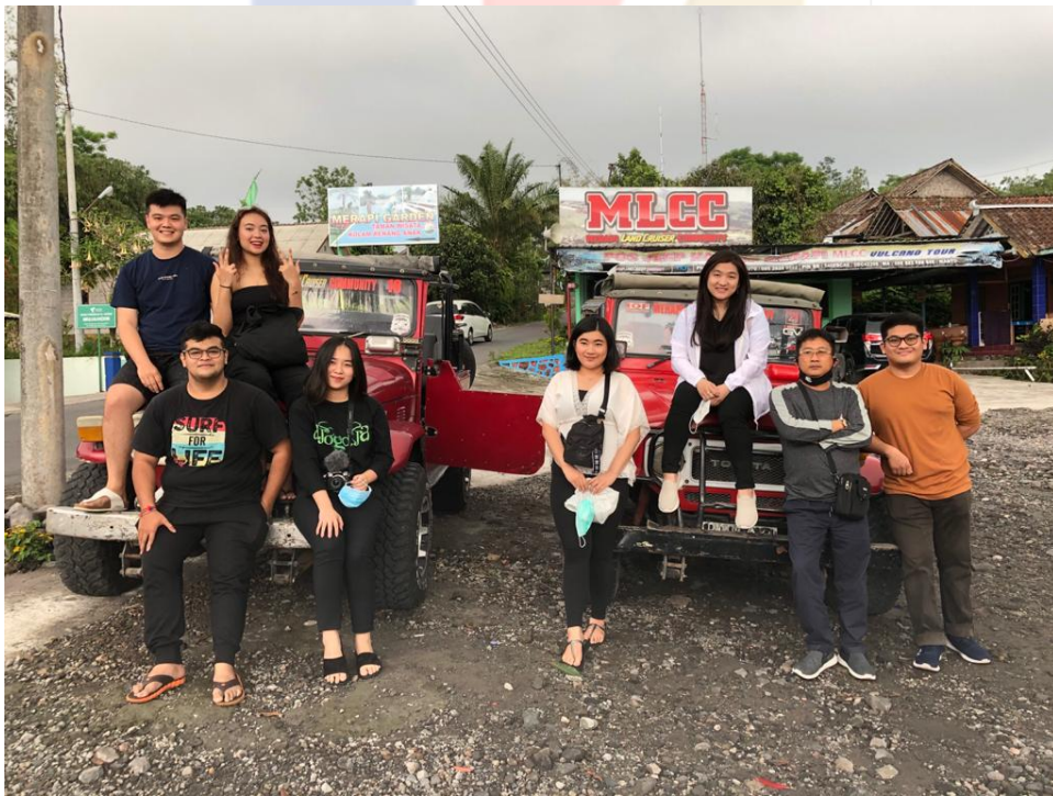
Lampiran 6 Lava Tour