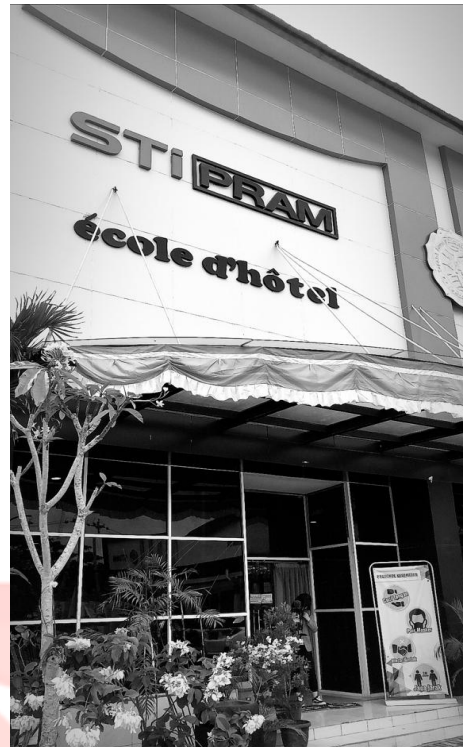
Lampiran 8 Kampus STIPRAM