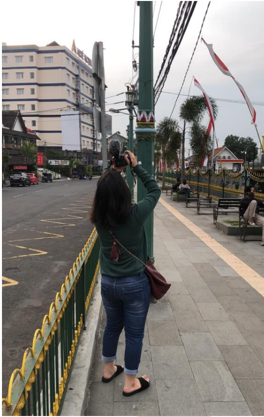
Lampiran 2 Stasiun Tugu Jogja