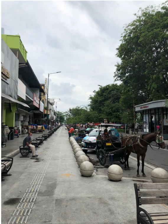
Lampiran 7 Jalan Malioboro