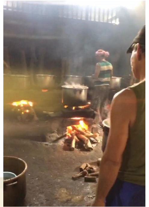
Lampiran 5 Tempat Penjualan dan Pembuatan Gudeg Yu Djum