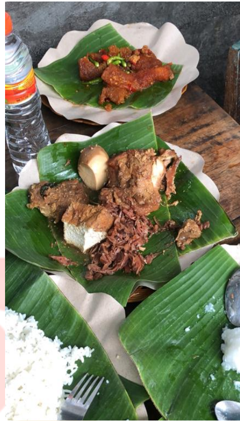
Lampiran 3 Gudeg Mbah Lindu