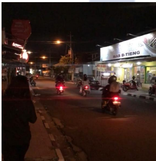
Lampiran 12 Jalan Wijilan (Center of Gudeg)