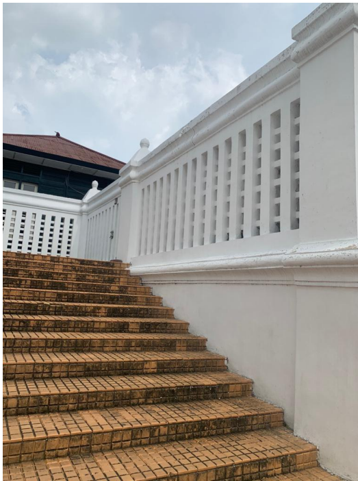
Lampiran 10 Keraton Jogja