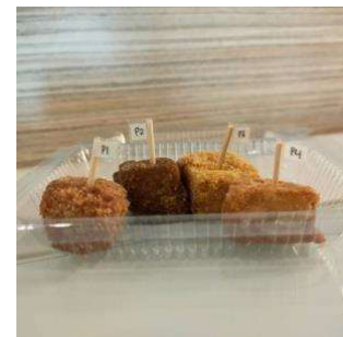
Kiri : Uji Organoleptik , Tengah : Uji Organoleptik , Kanan : Uji Hedonik