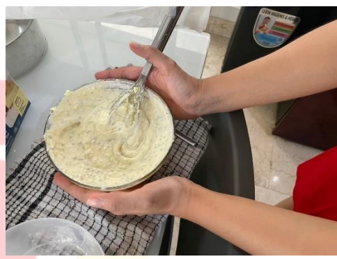
Membuat Adonan Basque Burnt Cheesecake