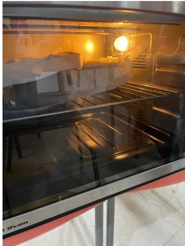
Pemanggangan Adonan Kue