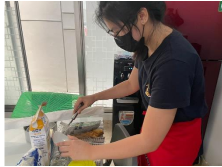
Menakar Bahan-bahan yang Diperlukan