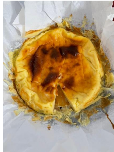
Salah Satu Hasil Akhir BBC Uji Coba