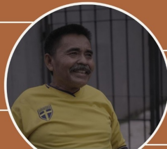
Notoraharjo 64 Tahun

Peningkatan resep seiring berjalannya waktu.