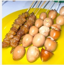
Sate-satean Rp 5.000/tusuk