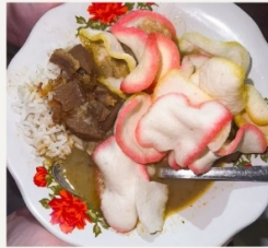
Nasi Gule Rp 10.000/porsi