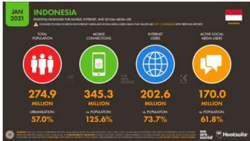
Gambar 1.1 Data Pengguna Media Digital di Indonesia 2021

Dalam memulai suatu usaha, pola pikir kewirausahaan sangat lah penting karena dengan pola pikir kewirausahaan seseorang akan selalu melakukan hal yang produktif dan terus berinovasi untuk menciptakan peluang yang menguntungkan (Suaidy & Ramli, 2019). Seorang wirausaha itu berusaha mencari cara jika sumber daya yang dimiliki nya terbatas dan cenderung menjadi pencipta lapangan kerja bukan orang yang mencari pekerjaan (Alexius Budianto, 2020). Seorang wirausaha harus memiliki pola pikir yang berbeda dengan orang rata-rata, lalu harus menciptakan hal-hal yang kreatif, harus memotivasi diri sendiri ataupun orang lain dan selalu menyikapi keadaan dengan senang hati serta tantangan yang ada bisa menjadi peluang (Amalia Rizki, 2022). Kita mungkin beranggapan bahwa wirausaha adalah pengusaha, usaha, uang yang banyak, untung rugi, banyak cabang nya dll tetapi terkadang kewirausahaan tidak melulu soal uang. Sesungguhnya kewirausahaan adalah pola pikir yang sebenarnya bisa dimiliki oleh semua orang. Tetapi karena kewirausahaan tidak pernah diajarkan oleh sekolah atau bahkan guru sekolah sehingga pola pikir anak anak yang akan tumbuh dewasa akan merasa aneh dan berbeda dengan yang diajarkan di sekolah. Padahal sangat lah penting untuk menanamkan semangat dan pola pikir kewirausahaan sejak dini.