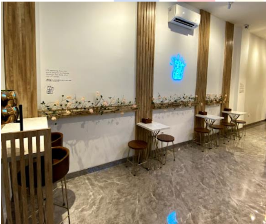
Tampak dalam Kopi Konnichiwa, Bekasi