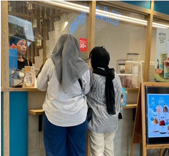
staf yang ramah menjelaskan secara detail terhadap pelanggan