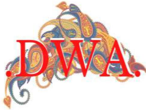
Figure 39. Logo Dwa Restaurant