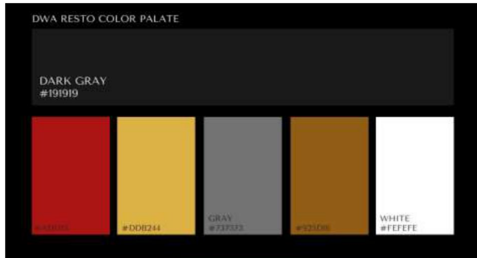
Figure 41. Color Palette Dwa Restaurant

Warna untuk Dwa Restaurant menggunakan warna abu, putih, coklat, emas, dan merah. Warna abu-abu dan putih digunakan hanya untuk dijadikan penetral dalam ruangan. Warna emas untuk menambahkan unsur kemewahan. Warna coklat akan memberikan kesan hangat dan nyaman untuk tamu. Warna merah akan dijadikan warna dekorasi utama karena secara psikologis warna merah adalah pemicu nafsu makan yang kuat.