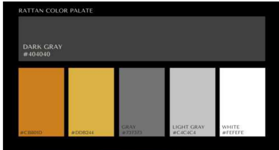
Figure 40. Color Palette Rattan

Warna dari Rattan Eco Hotel & Resort akan menggunakan warna netral yaitu abu-abu dan putih, kemudian juga menggunakan warna kuning emas sebagai warna utamanya. Warna kuning emas ini melambangkan kemewahan, kesuksesan, kemakmuran, dan juga prestasi. Dengan berharap agar Resort ini berhasil memberikan kemewahan yang sesuai dengan ekspektasi dari pendiri Rattan, sukses dan makmur selamanya, dan dapat memberikan prestasi yang membanggakan setiap tahunnya. Setiap warna pilihan tersebut akan menjadi kombinasi sempurna untuk setiap bangunan dan ruangan yang ada di Rattan Eco Hotel & Resort.