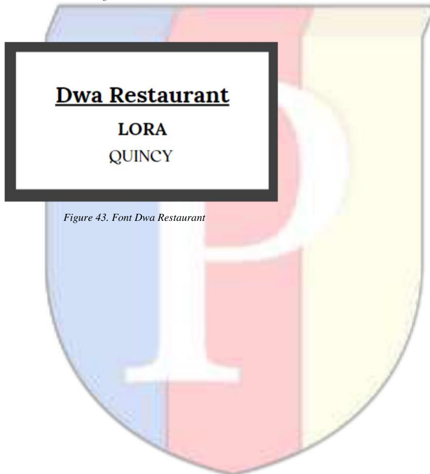
Figure 43. Font Dwa Restaurant