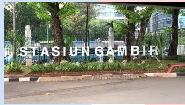
Gambar 4. 1 Stasiun Gambir