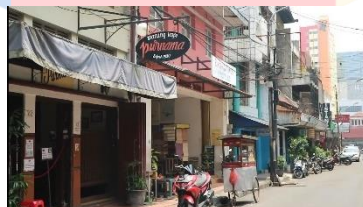
Gambar 4. 6 Warung Kopi Purnama