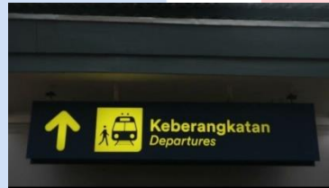
Gambar 4. 13 Closing