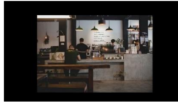
Gambar 4. 12 Kafe Modern

Scene ini menampilkan beberapa foto serta penjelasan dari storyteller mengenai bisnis kopi dan kafe modern yang banyak terdapat di Kota Bandung.