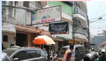
Gambar 4. 5 Jalan Alkateri

Scene ini menampilkan Jalan Pecinan Lama dan apa saja yang terdapat disana serta aktivitas yang dilakukan oleh masyarakat sekitar. Jalan ini merupakan jalan yang mengelilingi Jalan Alkateri yang disebut juga Kampung Arab, di dalamnya terdapat banyak toko-toko yang menjual bahan tekstil seperti gordena dan karpet. Ditengah berbagai macam penjual bahan tekstil, jalan ini memiliki sebuah warung kopi yang sudah berusia hampir 100 tahun yang banyak digemari oleh masyarakat Bandung dan juga pendatang dari luar Bandung.