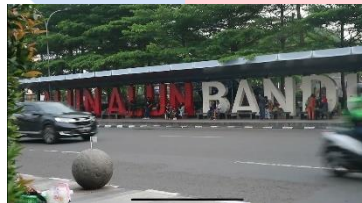
Gambar 4. 4 Alun-Alun Kota Bandung