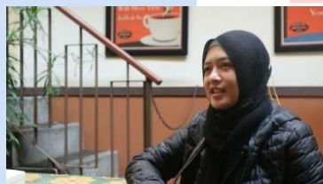
Gambar 4. 9 Interview Pengunjung 1