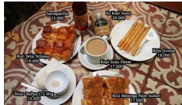
Gambar 4. 8 Makanan dan Minuman Warung Kopi Purnama

Scene ini menampilkan berbagai macam menu makanan dan minuman andalan dari Warung Kopi Purnama. Footage-footage makanan yang ditampilkan akan ditambahkan teks berupa nama dan harga dari makanan tersebut. Menu yang dipilih sebagian besar merupakan menu yang sering dipesan oleh para pengunjung yaitu ada aroma cheese, roti selai srikaya, roti mentega palm suiker, baso, soto ayam, nasi goreng purnama, telur ½ matang, kopi susu panas dan sarsaparilla. Pada scene ini akan diisi dengan voice over berupa ulasan dari storyteller .