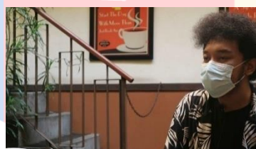
Gambar 4. 11 Interview Pengunjung 3

Scene ini menampilkan wawancara dengan 3 pengunjung Warung Kopi Purnama. Target wawancara yang dipilih yaitu mahasiswa, pengusaha, dan ibu rumah tangga. Pertanyaan yang ditanyakan merupakan pertanyaan mendasar.