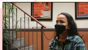
Gambar 4. 10 Interview Pengunjung 2