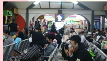
Gambar 4. 14 Closing

Scene ini menampilkan jadwal kereta, suasana di dalam stasiun, dan menyorot Stasiun KAI Bandung dari luar pada saat sore hari sebagai penutup. Bertujuan untuk menunjukkan kepulangan ke Jakarta.