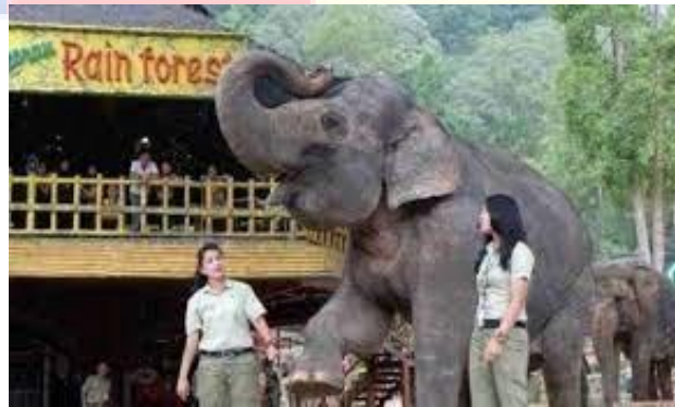
Gambar 2.3 Elephant Show Taman Safari Bogor

Pertunjukan ini diadakan setiap hari pada pukul 11:30 dan 16:30 di Plaza Gajah. Adapun latar belakang dari pertunjukan ini yaitu cerita-cerita Ganesha pada 1982, konflik yang terjadi antara Gajah dan Manusia. Pertunjukan ini juga memberikan edukasi tentang kewajiban untuk senantiasa menjaga habitat gajah yang kini semakin hari semakin punah.