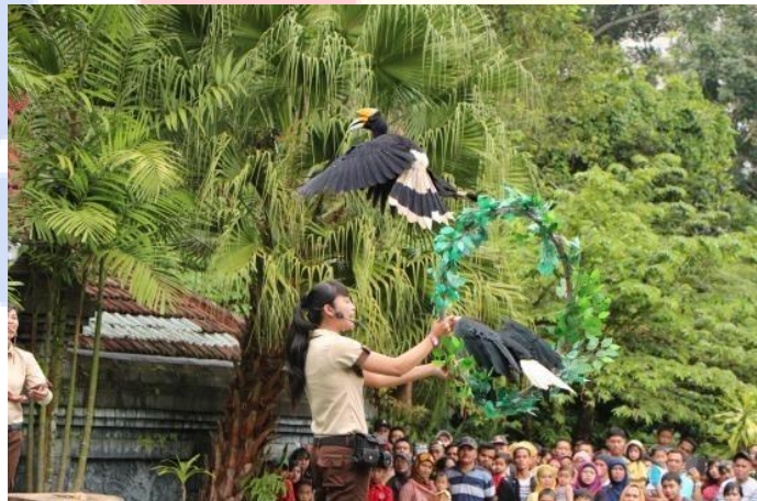
Gambar 2.8 Birds of Prey Taman Safari Bogor

Pertunjukan ini diadakan setiap hari pada pukul 14:00 dan 15:30 di lapangan Burung Pemangsa. Pada pertunjukan ini, wisatawan tidak hanya dapat melihat pertunjukan yang dilakukan oleh burung pemangsa, namun juga dapat memberikan makanan atau bahkan bisa foto bersama dengan burung tersebut.