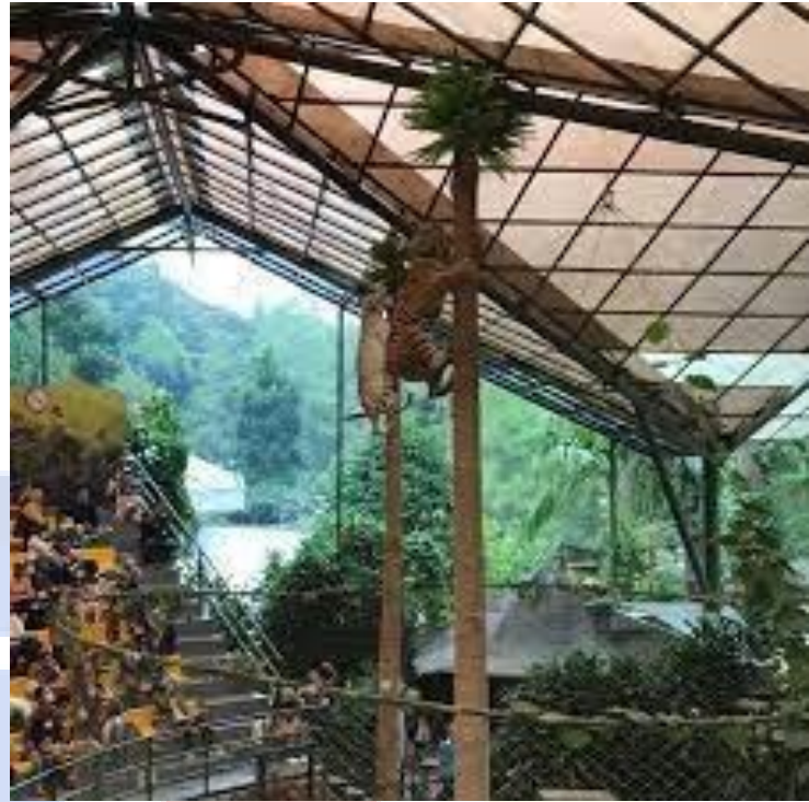
Gambar 2.6 Raja Rimba Taman Safari Bogor