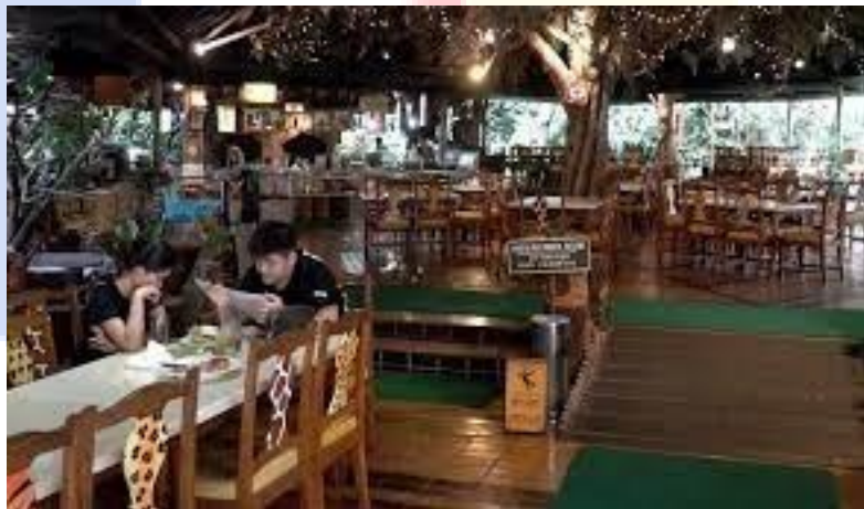
Gambar 2.1 Food Court di Taman Safari

Di Kawasan wisata Taman Safari Bogor ini terdapat berbagai restoran yang lebih menekankan pada berbagai cita rasa kuliner dengan beragam variasi menu, kualitas, dan harga. Adapun beberapa restoran yang dimaksud, diantaranya Rimba Food Court dan Restoran Panda, serta Restaurant Rainforest .