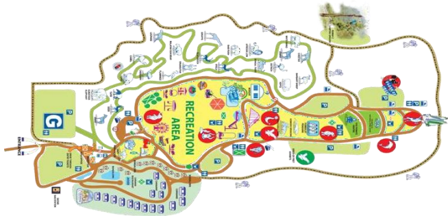
Gambar 2.1 Peta Taman Safari Bogor

Adapun pintu masuk khusus pengunjung dari mancanegara untuk menuju ke Taman Safari Bogor ini hanya satu, yaitu melalui Bandara Internasional Soekarno Hatta yang tentunya dengan beragamnya jadwal penerbangan. Akses menuju ke Taman Safari Bogor dengan jarak tempuh berkisar 2-3 jam. Adapun jalur dari bandara menuju Kawasan Taman Safari Bogor ini telah terhubung dengan berbagai tempat yang merupakan penunjang kegiatan yang mendorong seperti hotel, atm, shopping center , money changer , dan restoran. Dengan hal itu, untuk menuju ke Kawasan Taman Safari Bogor ini Bandara Soekarno Hatta telah menjadi pintu masuk utama khususnya bagi peserta insensitif.