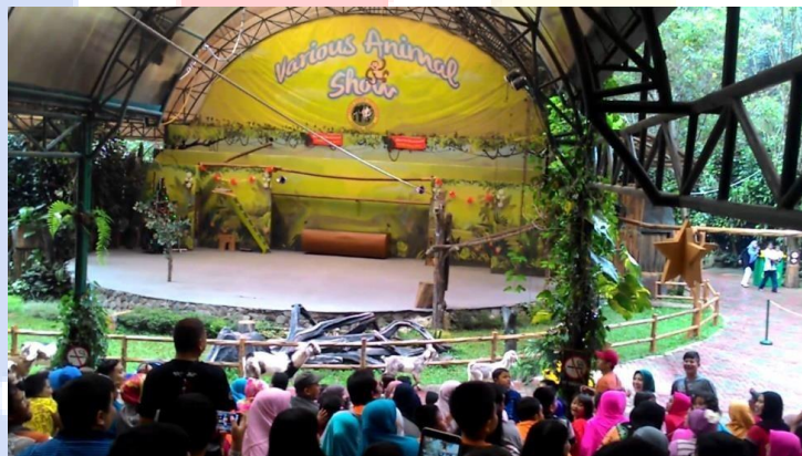
Gambar 2.5 Various Animals Show Taman Safari Bogor

Pertunjukan ini diadakan setiap hari pukul 11:30 dan 15:00. Diharapkan setelah wisatawan menonton pertunjukan ini, akan lebih mengenal aneka satwa yang ada.