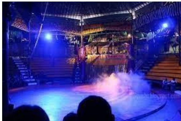
Gambar 2.4 Safari Theatre Taman Safari Bogor