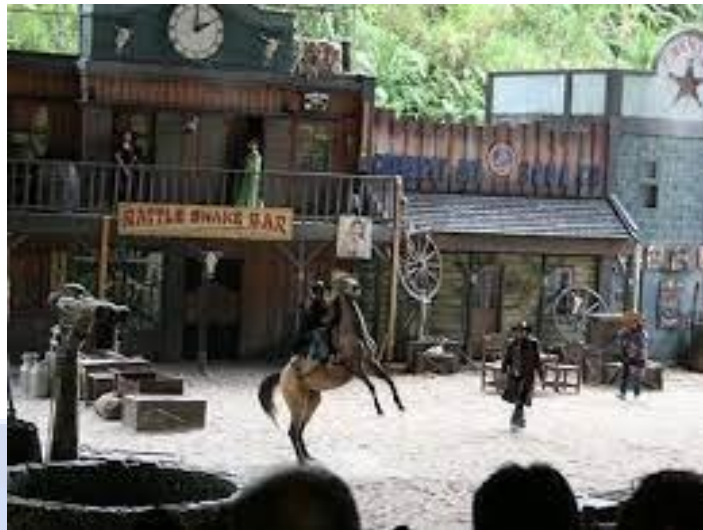
Gambar 2. 0 Cowboy Show Taman Safari Bogor