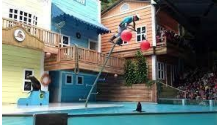
Gambar 2.7 Sea Lion Taman Safari Bogor