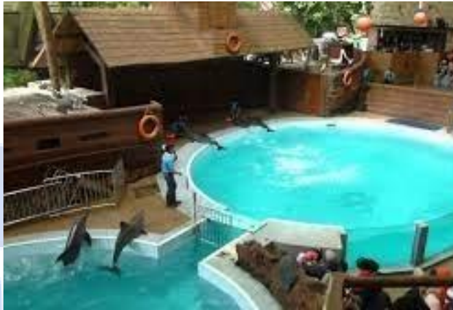
Gambar 2.9 Dolphin & Friends Taman Safari Bogor

wisatawan akan melihat pertunjukan 18 lumba-lumba yang sangat pandai dan ekornya yang kuat. Selain itu, para wisatawan juga dapat menyaksikan lumba-lumba yang melompat sangat tinggi.