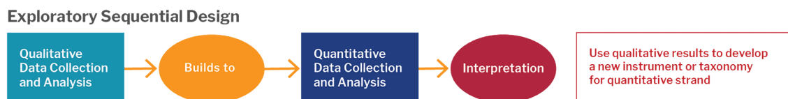
GAMBAR 3.1 Bagan Exploratory Sequential Design

Jenis mixed methods yang digunakan adalah The Exploratory Sequential Design adalah metodologi penelitian yang digunakan di perancangan ini. Model penelitian campuran diawali dengan pengumpulan data kualitatif dan analisisnya, kemudian dilanjutkan dengan pengumpulan dan analisis data kuantitatif. Pada tahap pertama, tujuan pengumpulan data kualitatif adalah terlebih dahulu mengkaji fenomena yang ada kemudian dilanjutkan dengan pengumpulan data kuantitatif untuk memperjelas hubungan antar variabel dalam data kualitatif (Creswell, 2011).